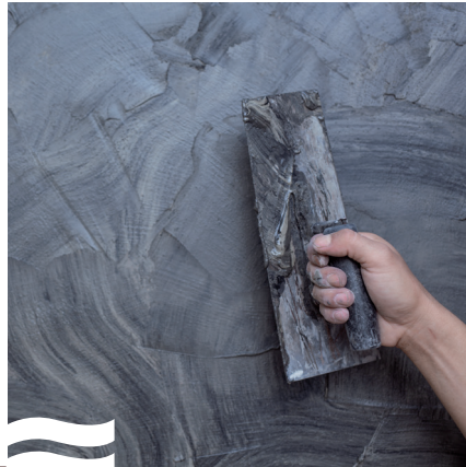
APPLICATION DE PRODUITS DÉCORATIFS