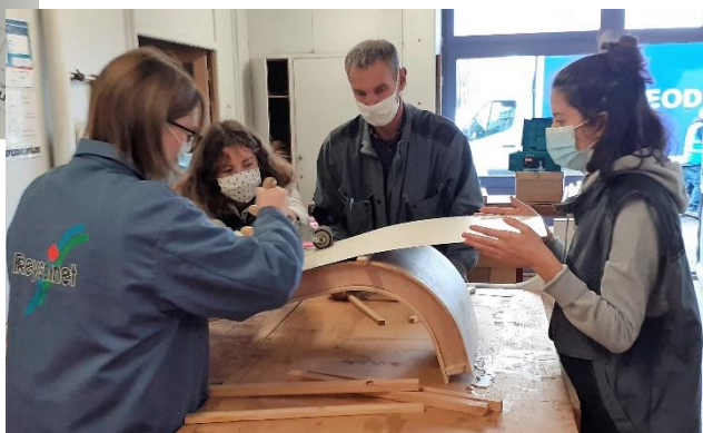
Réalisation d'un prototype